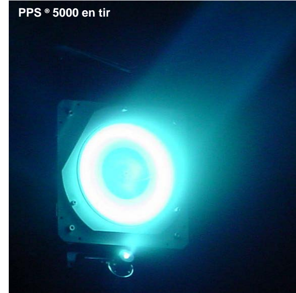
PPS® 5000 en tir

Quatre PPS® 5000, 5kW, 30 g de poussée pour mettre en orbite le satellite puis le maintenir à poste pendant 15 ans.